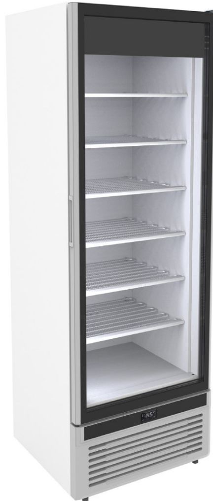
HEAVY DUTY GLEE IV40 NS G