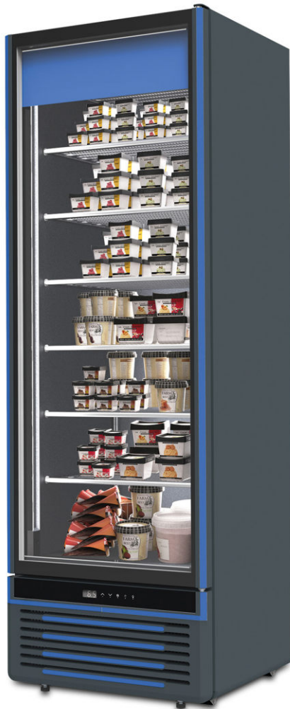
HEAVY DUTY PRIME IV40 NV P