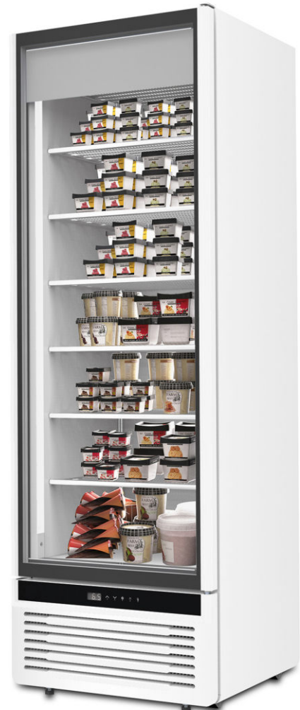
HEAVY DUTY LITE IV40 NV L