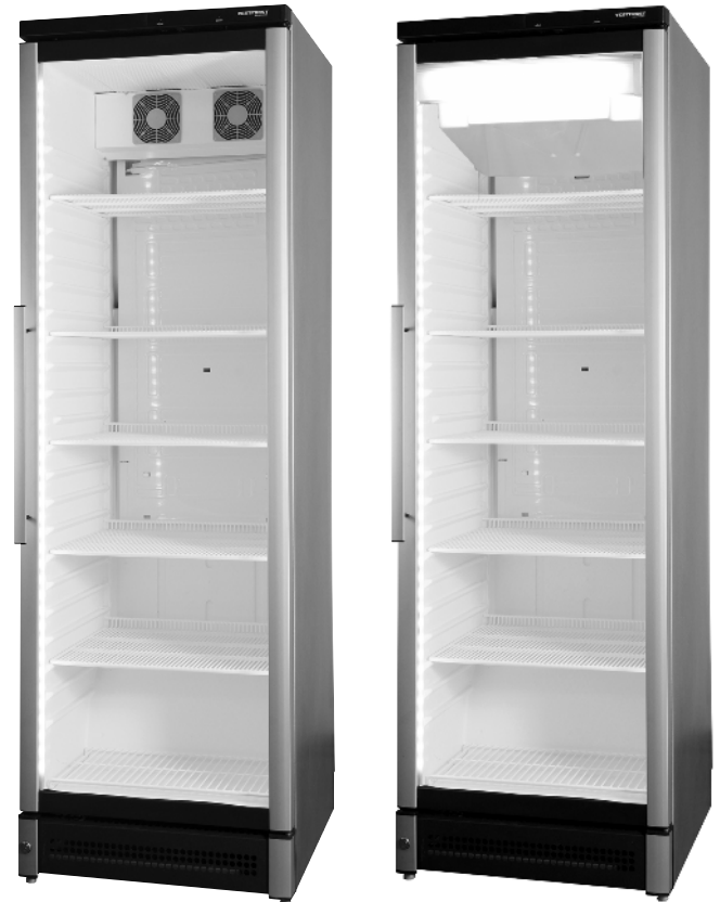
ECONOMIC D V 180 PV